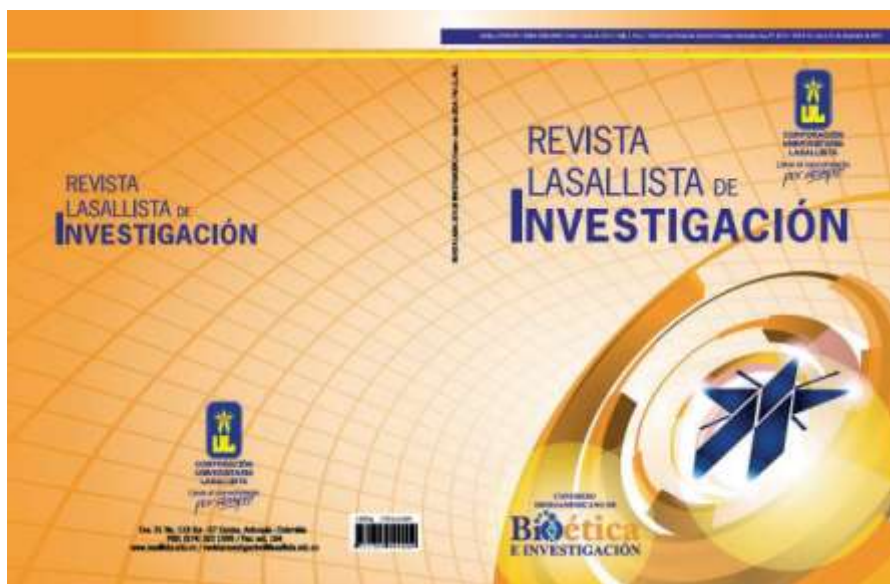
Imagen 4. Carátula de la Revista Lasallista de Investigación Vol. 11, n° 1, edición especial de Bioética

En 2014 se publicaron los números 1 y 2 del Volumen 11 de la Revista Lasallista de Investigación. En las imágenes 4 y 5 se muestran las carátulas y en las tablas 43 y 44 el contenido de los respectivos números.