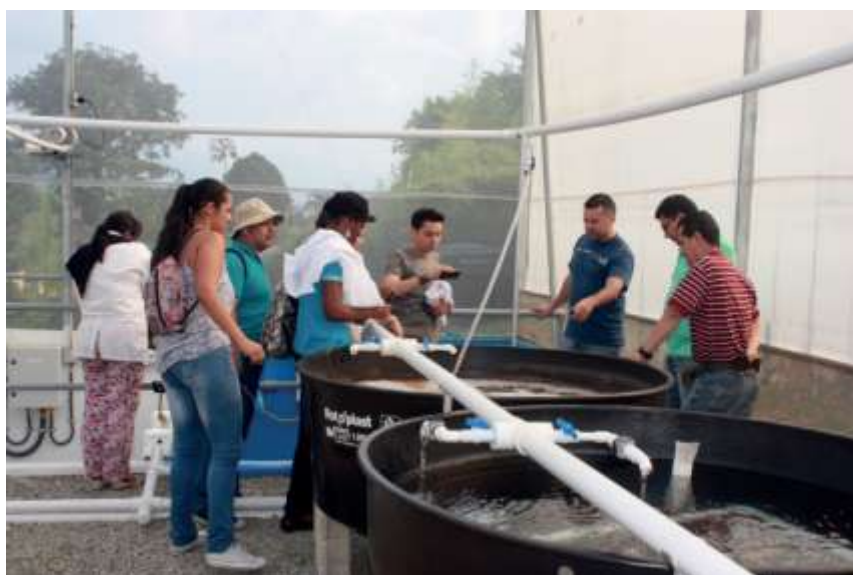
Foto 2. Laboratorio de Acuicultura. Sistema de Recirculación para Peces