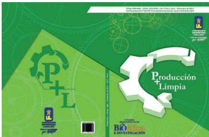
Imagen 7. Carátula de la Revista Producción+Limpia Vol. 9, n° 2