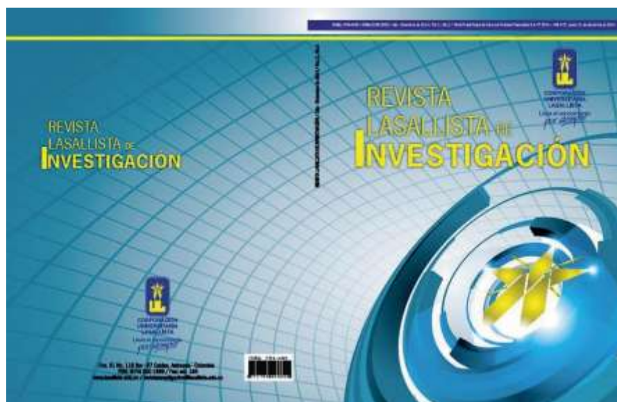
Imagen 5. Carátula de la Revista Lasallista de Investigación, Vol. 11, no. 2.