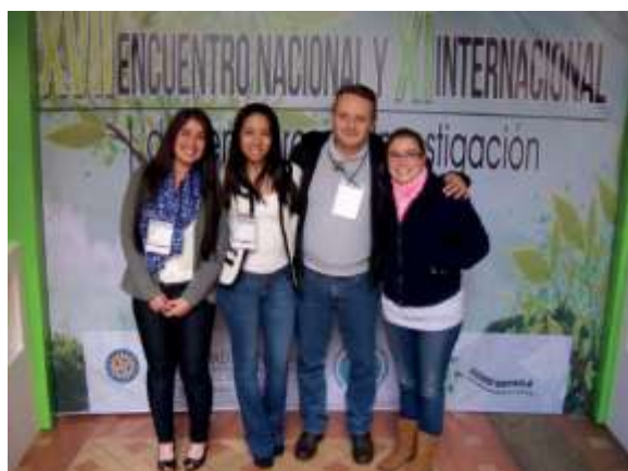
Fotografía 3. XVII Encuentro nacional y XI Internacional de Semilleros de Investigación Redcolsi