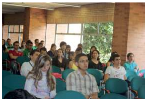
Fotografía 1. Presentación de proyectos en el V Encuentro Institucional de Semilleros de Investigación