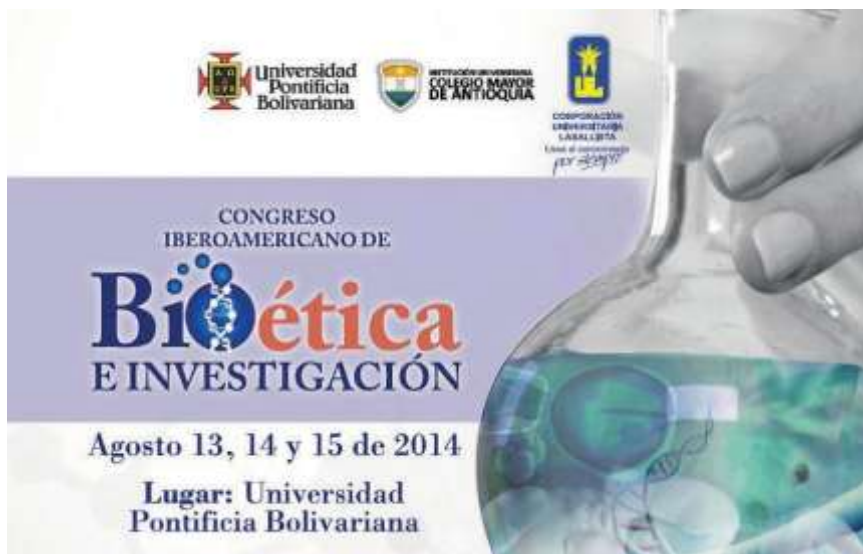
Imagen 3. Imagen del Congreso Iberoamericano de Bioética e Investigación