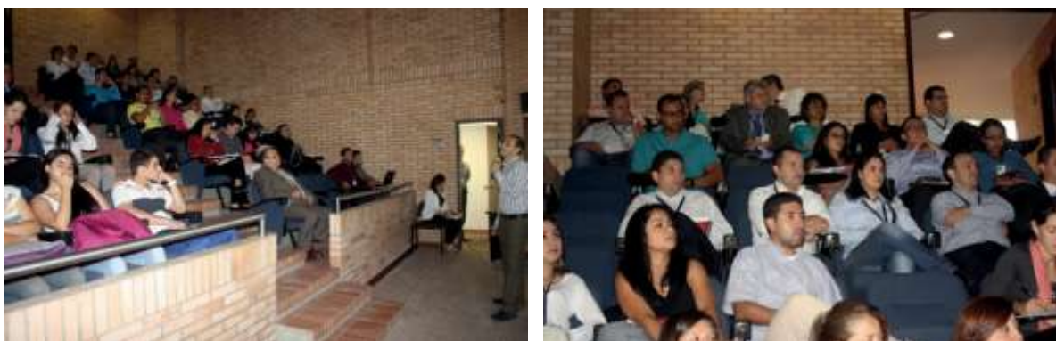
Fotografía 4. Ponencias desarrolladas en el Mes de la Investigación Lasallista-Sexta Versión 2014